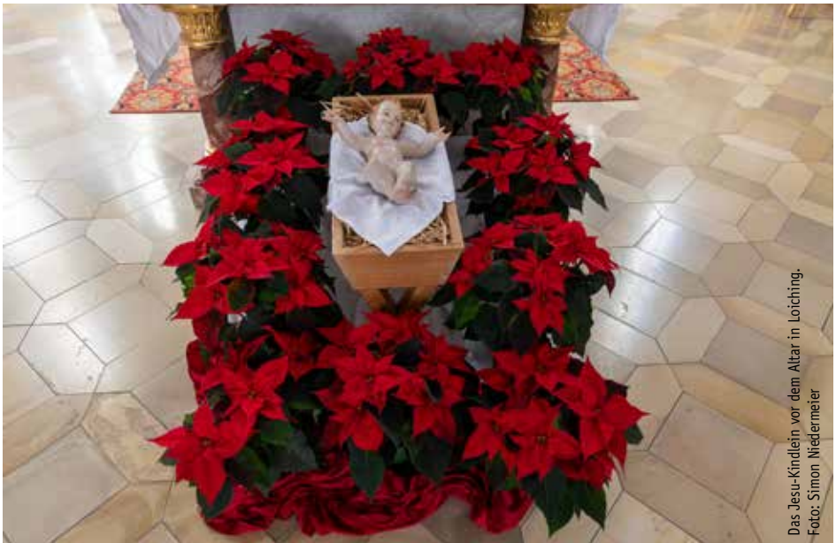
Das Jesu-Kindlein vor dem Altar in Loiching.