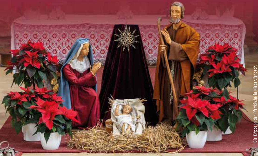
Die Krippe in der Pfarrkirche in Niederviehbach.