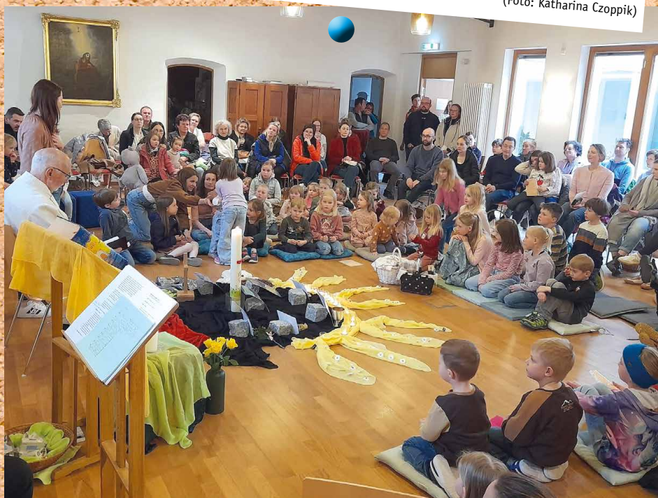
Der voll besetzte Pfarrsaal bei der Osterandacht für Kinder in Niederviehbach.